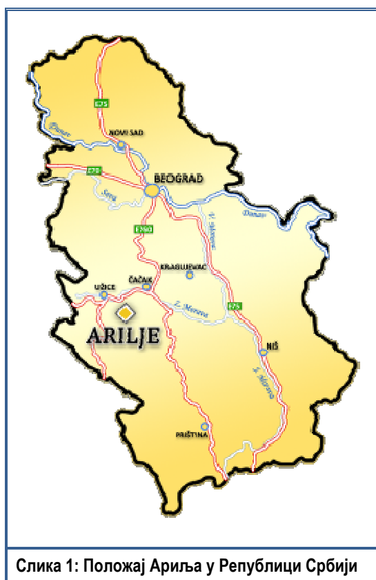
Слика 1: Положај Ариља у Републици Србији