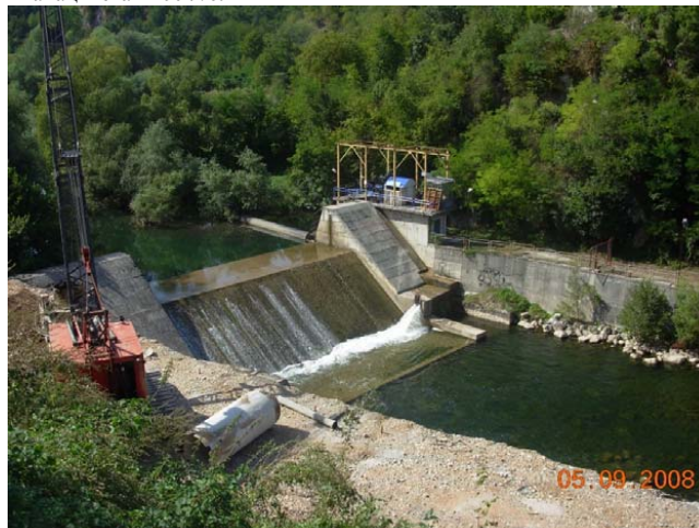
Слика 2. Захват на прегради „Шевељ“

Регионални водоводни систем „Рзав“ – Овај систем сада опслужује водом становништво и привреду насеља у општинама Ариље, Пожега, Лучани, Чачак и Горњи Милановац, и то из захвата из живог тока реке Рзав на постојећој прегради „Шевељ“ (привремено захват – слика 2), а пречишћава на ПППВ „Ариље“ на локацији „Клик“ капацитета 1200 л/с.