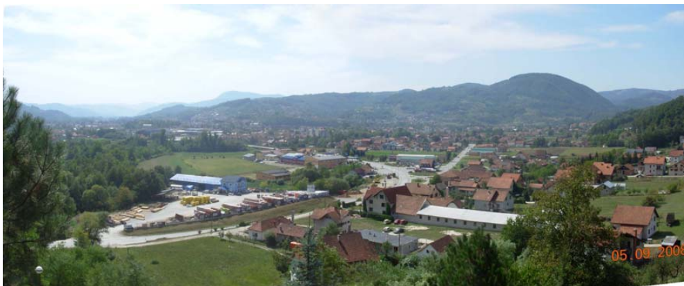
Слика 3. Ариље са околином

Зона насеља Ариље са приградским сеоским насељима (Поглед, Вигоште, Церова, Вране, Грдовићи и Вирово – слика 3), у којима је претежно развијен секундарни и терцијарни сектор делатности, и Ариљем као доминантним центром развоја.