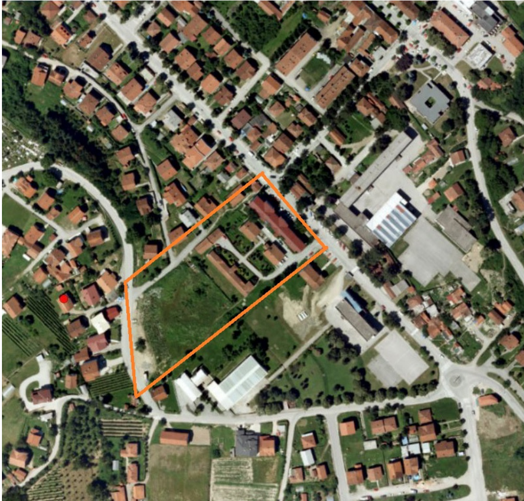
Slika br. 1 Šire okruženje lokacije

Prvomajske ( izgrađena na terenu u velikom padu, manje povoljna za kolsko-pešački saobraćaj ) i sa ulice Vitomira Molera ( ova ulica je najnepovoljnija za kretanje kolskog saobraćaja -nagib 15%- i na terenu je izgrađena kao slepa ulica bez adekvatne okretnice).