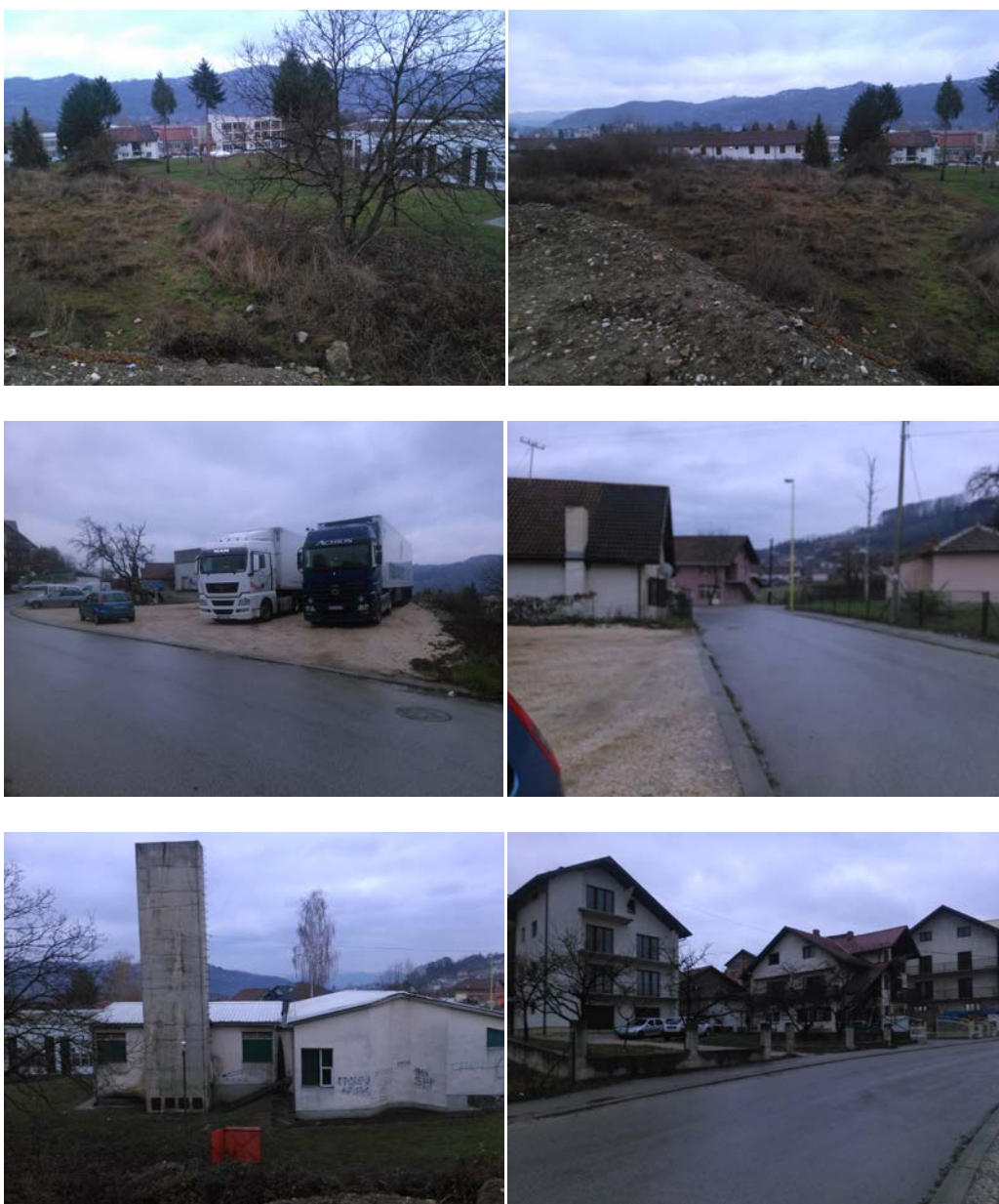
Slika br. 2. Uža lokacija

Na osnovu privremene seizmološke karte SFRJ iz 1982.godine ispitivano područje se nalazi u oblasti sa stepenima seizmičnosti 8° MKS skale, što ne predstavlja veću seizmičku ugroženost, koja bi uslovljavala posebne mere izgradnje objekata i adekvatnu prostornu organizaciju. Povećanje ili smanjenje stepena seizmičkog intenziteta nije istraženo, obzirom da nije vršena mikroseizmička reonizacija za potrebe izrade urbanističko-planske dokumentacije.