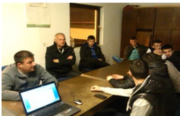
Izrada profila MZ Mirosljci 18.03.2014.