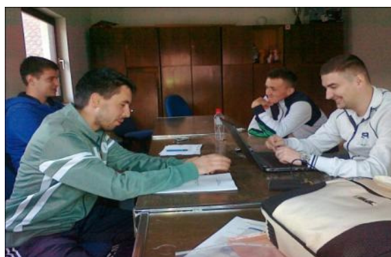
Izrada strateške platforme MZ Mirosljci .2014.