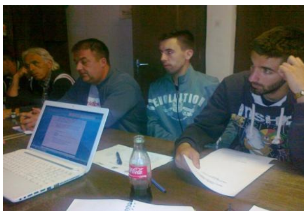
Javna rasprava u MZ Mirosljci 29.05.2014.