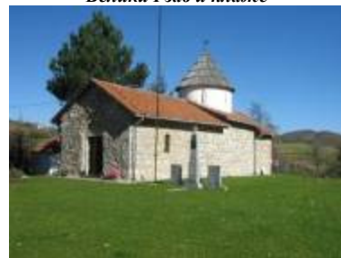
Црква Светог Николе у Брекову