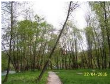
Острво Уски вир