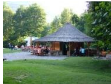
Велики Рзав и плаже