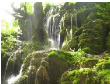
Водена пећина са слаповима Пањице