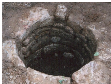
Археолошко налазиште Римски бунар