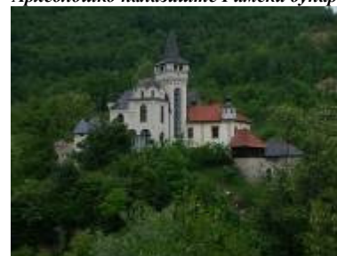
Кућа академског сликара Љубивоја Јовановића