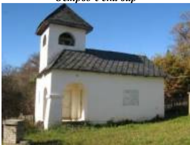
Црква Свете Тројице у Бјелуши