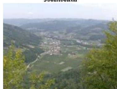
Градина и црква Светог Илије