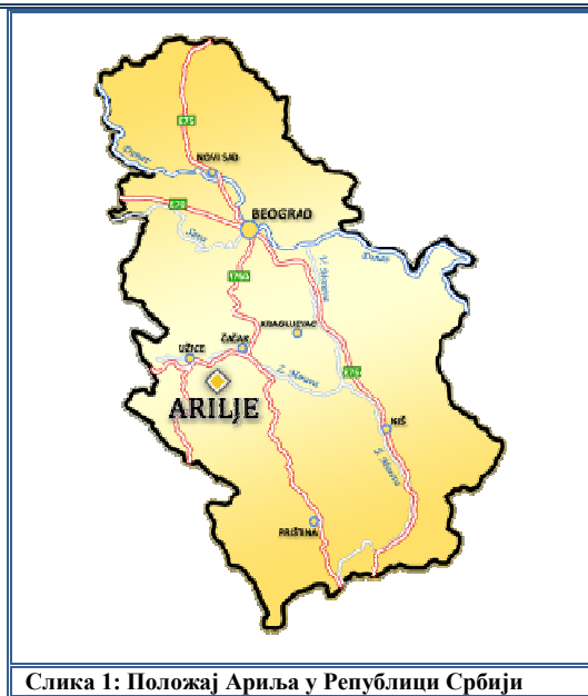
Слика 1: Положај Ариља у Републици Србији